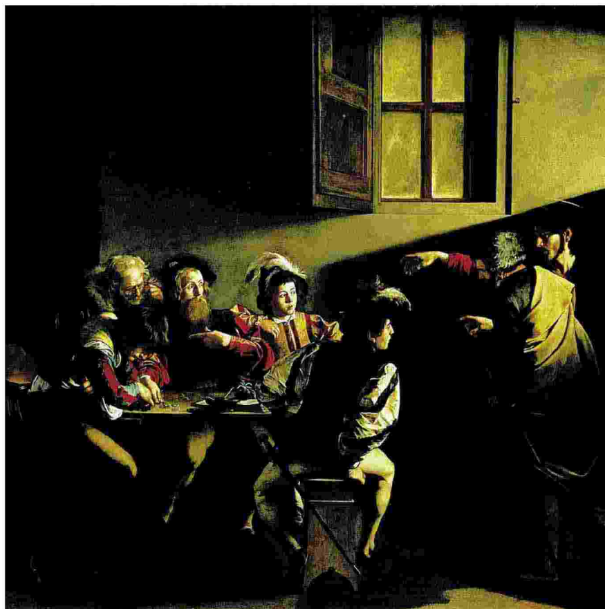
Caravaggio, "Vocazione di san Matteo", 1599-1600

Insiste Ratzinger, senza sminuire l'importanza dell'esegesi storico-critica: "Come risultato comune di tutti questi tentativi [si riferisce alle ricostruzioni del Gesù storico realizzate dalla ricerca scientifica soprattutto a partire dagli anni Cinquanta] è rimasta l'impressione che, comunque, sappiamo ben poco di certo su Gesù e che